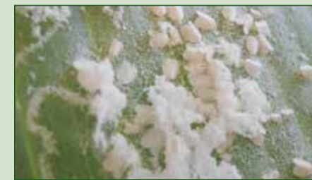
Aleurodicus dispersus , Tejina, 2 aplicaciones, 41 días de intervalo Volumen de agua: 3.000 L/ha Control: Insectos/hoja 39

Es importante efectuar monitoreos y hacer los tratamientos cuando se detecten las primeras ninfas. Las hembras adultas tratadas muestran una reducción en la fecundidad (menor cantidad de huevos) y en la fertilidad (menos huevos viables).