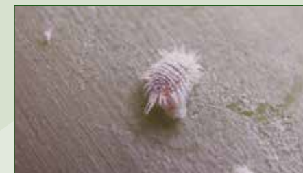
Dysmicoccus grassii , Tejina, 2 aplicaciones, 41 días de intervalo Volumen de agua: 3.000 L/ha Control: % Superficie cubierta 14

Movento® Gold es principalmente activo sobre estadios jóvenes. Se recomienda el uso al inicio de la infestación de la plaga.